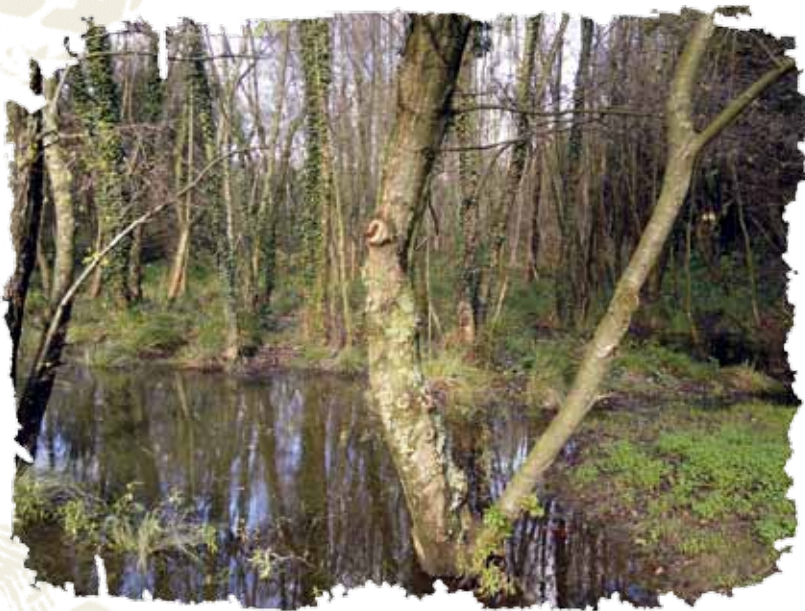
Zona húmida da Bouza / Novocontorno

O municipio de Vigo conta con diversas zonas húmidas de auga doce, que ocupan máis de 200.000 m 2 . As máis representativas son as da Bouza, Muíños e Barreiro, que están en terreos públicos e foron obxecto de traballos de recuperación nos últimos anos. As de Goberna, o Vao e Fontes-Pertegueiras, que están en espazos privados. Entre todas acollen unha importante biodiversidade que é parte do patrimonio natural do Concello de Vigo.